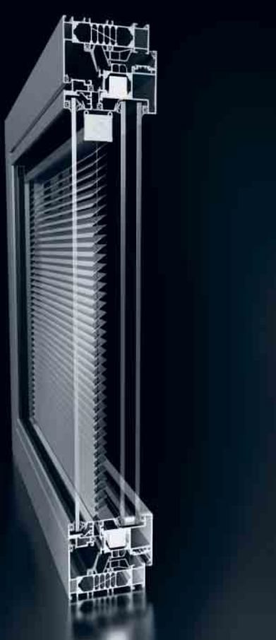
Integriert liegender Sonnenschutz Bedienung über Funkgriff Integrated solar shading Operated via remote control handle

Die Verbundfensterkonstruktion mit höchster Wärmedämmung und Schallschutz: