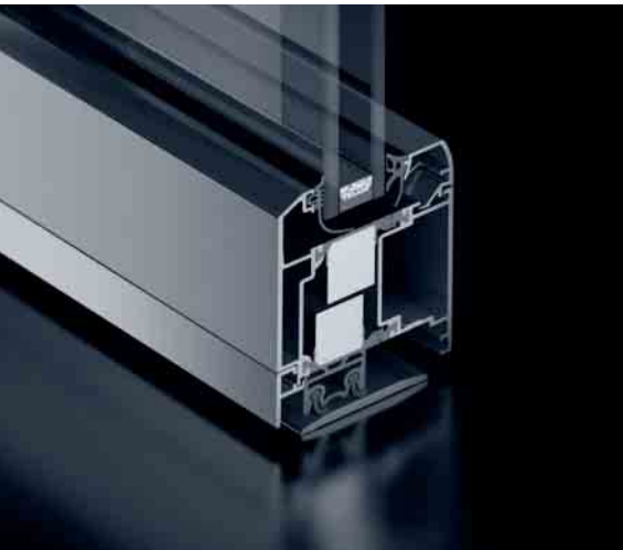
Schüco Tür ADS 75 RL.SI Schüco Door ADS 75 RL.SI