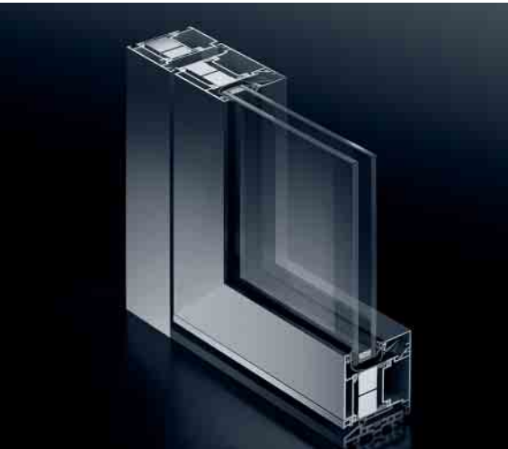
Schüco Tür ADS 75.SI Schüco Door ADS 75.SI

Die höchstwärmege­däm­mte Tür für maximale Ansprüche an das Energiemanagement in Kombination mit funktionellen Ansprüchen.